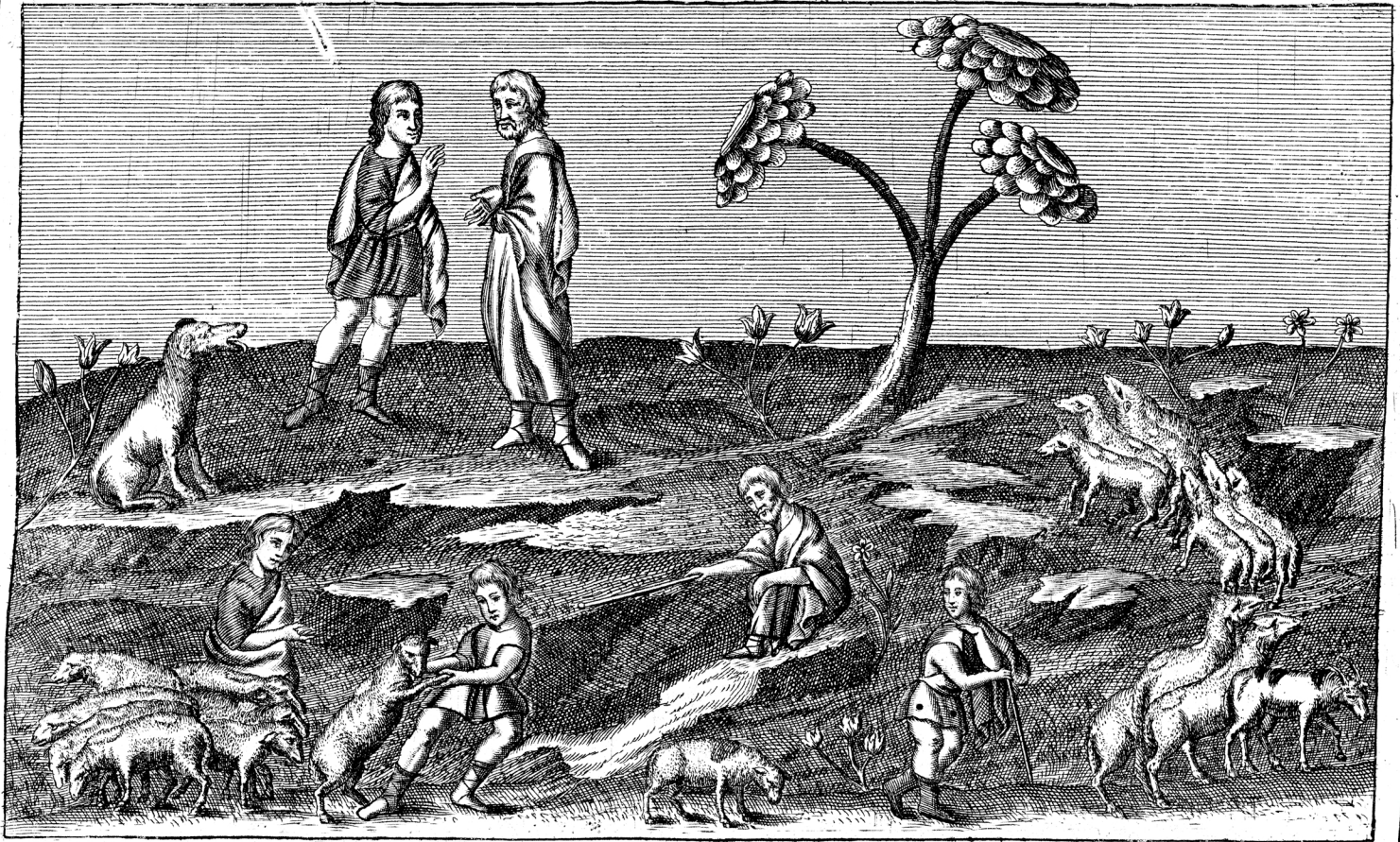
Iconismus hic pertinet ad Commentariorum de Augustissimâ Bibliothecâ Casarâ Vindobonensi Librum tertium, et est inferendus inter pag. 6 et 7. Sadh. sculp.